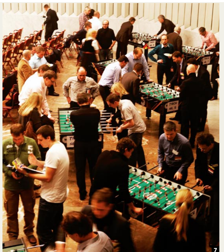
7 Spaß, Spannung und sportlicher Ehrgeiz beim 1. FLIESEN & PLATTEN-Kickerturnier